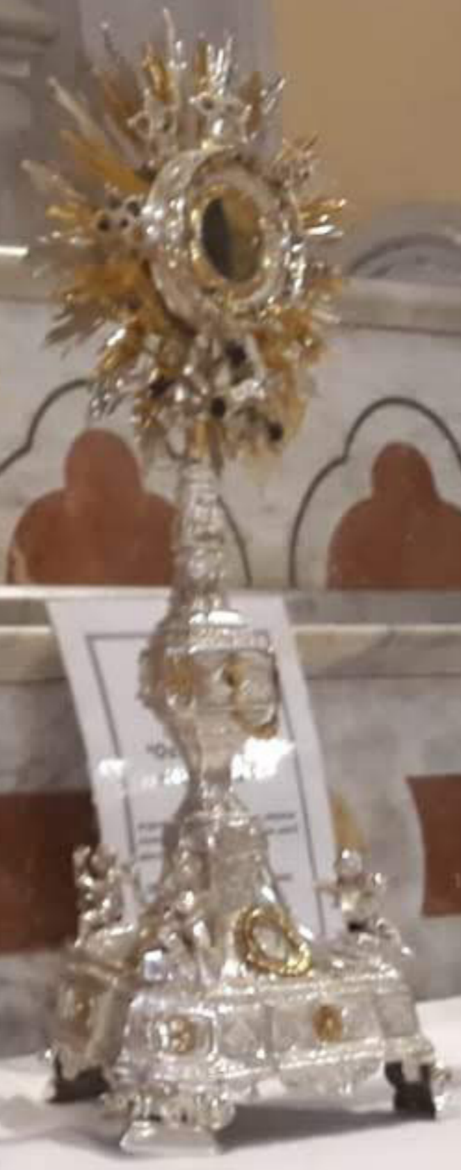
Argentiere palermitano "Ostensorio a raggiera" argento lavorato a mano, lamina- tione, sbalzo, eccollatura. (Mistretta, Chiesa Madonna del Carmine)