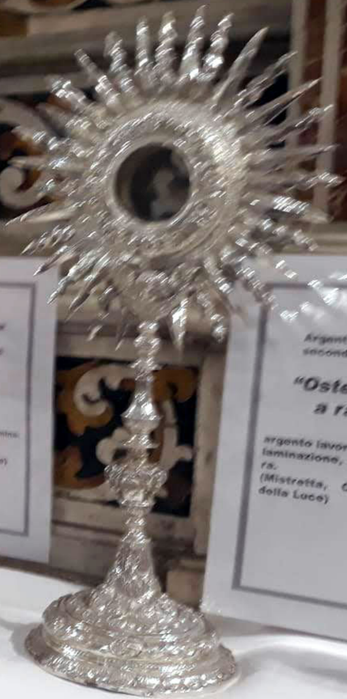
Argentiere di Messina seconda metà XVII "Ostensorio a raggiata" argento lavorato a fusione, laminazione, sbalzo, cesellatura. (Mistretta, Chiesa Madre della Luce)