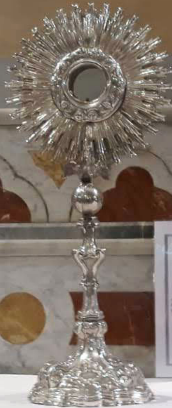
Argenteria di Palermo 1775 "Ostensorio a raggiera" argento lavorato a mano, cesellato, sbalzato, cesellato e (Museum, Santa Caterina)