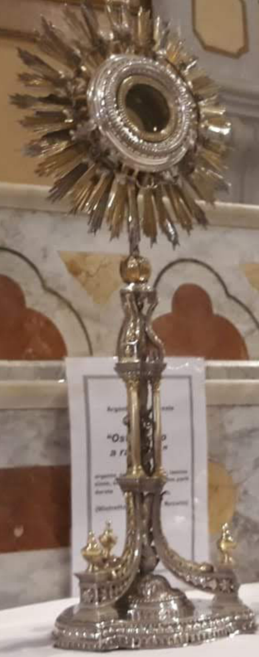
Argentiere palermitano "Ostensorio a raggiera" argento lavorato a mano, lamina- tione, sbalzo, eccollatura. (Mistretta, Chiesa Madonna del Carmine)