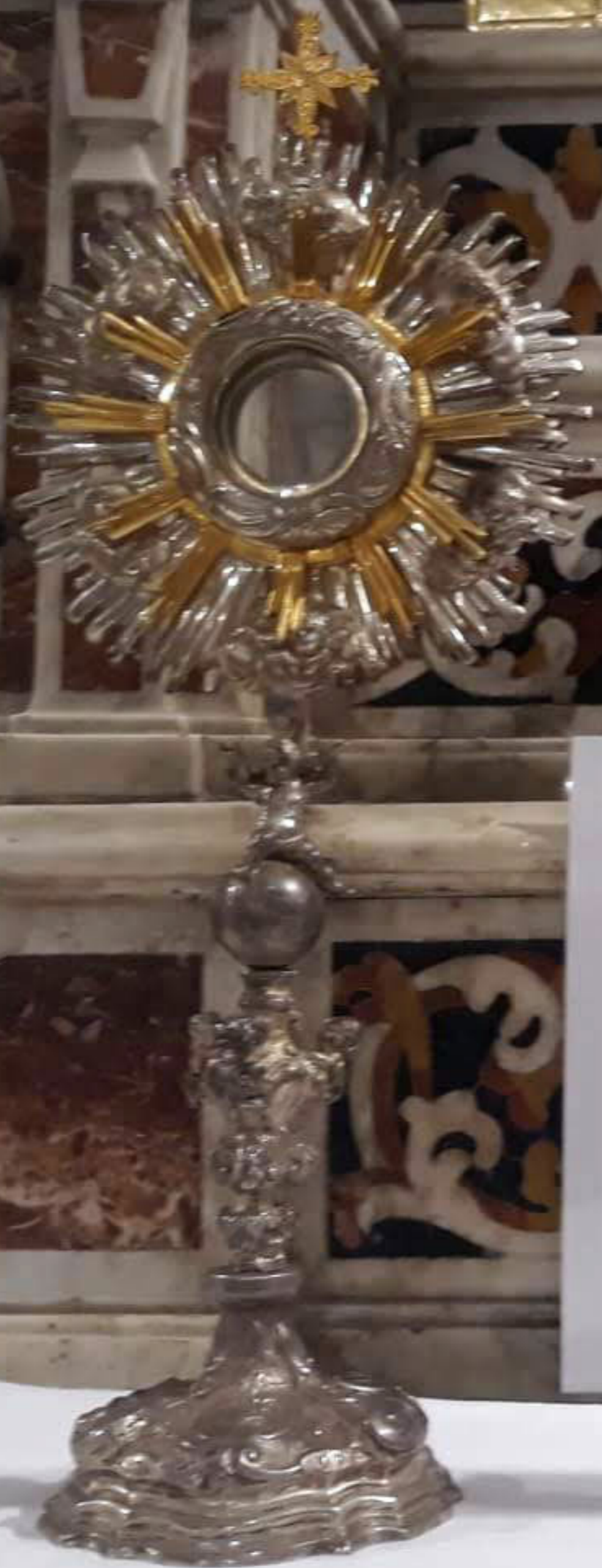
Argentiere di Messina(?) seconda metà XVIII sec "Ostensorio a raggiera" argento lavorato a fusione, lamina- zione, sbalzo, cesellatura, con parti dorate (Mistretta, Chiesa S. Maria di Gesù)

Messina(?) XVIII sec io ra" vina, modellato Madonna