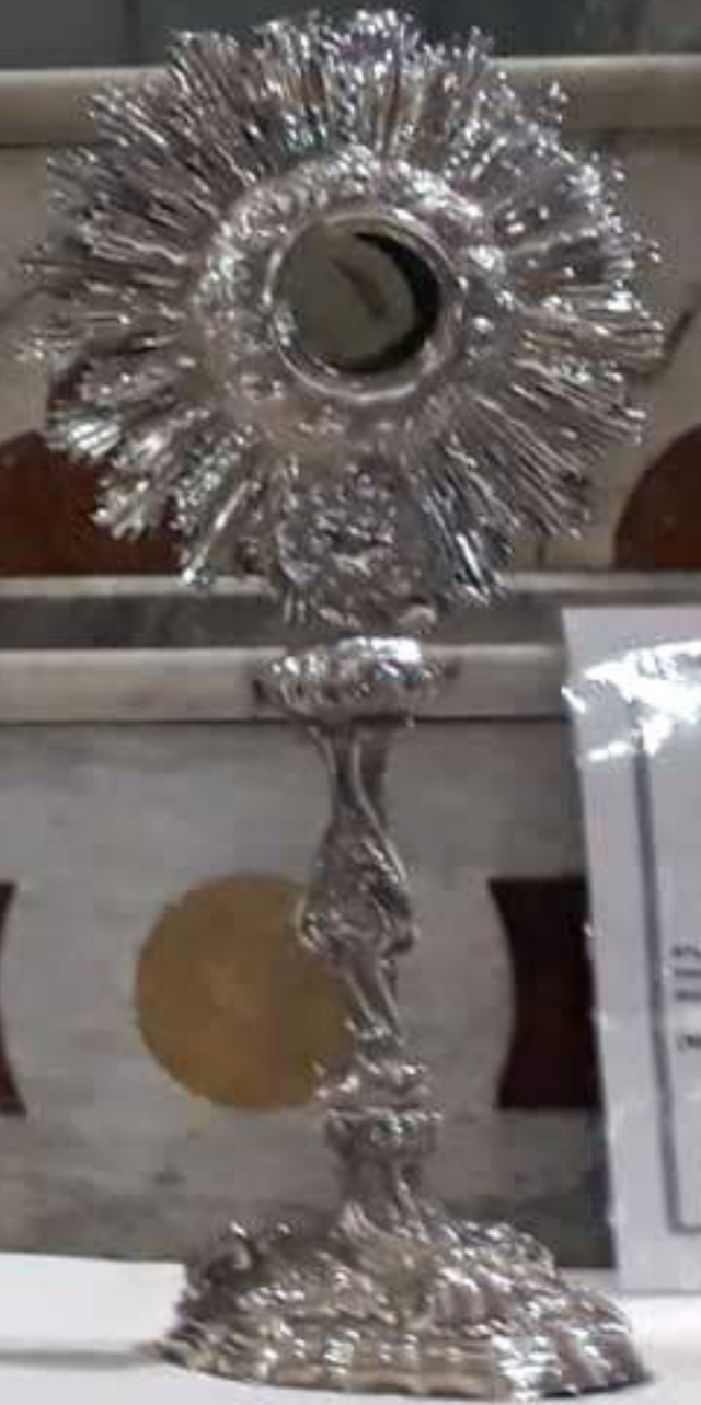
Argenteria di Palermo 1778 "Ostensorio a raggiera" argento lavorato a mano, cesellato, sbalzato, cesellato e (Museum, Chiesa S. Sebastiano)