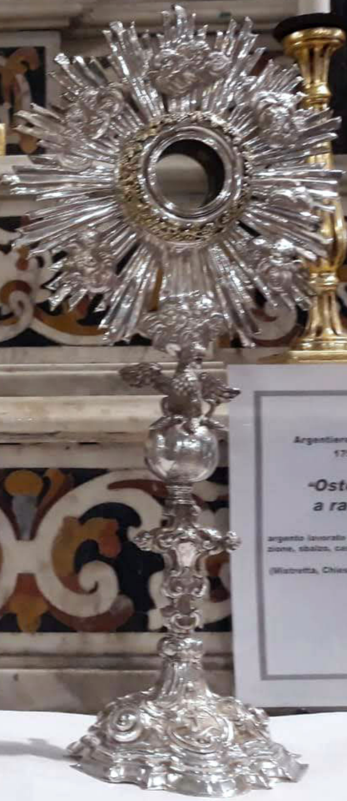
Argentiere di Messina(?) 1756 "Ostensorio a raggiera" argento lavorato a fusione, lamina- zione, sbalzo, cesellatura. (Mistretta, Chiesa San Francesca)