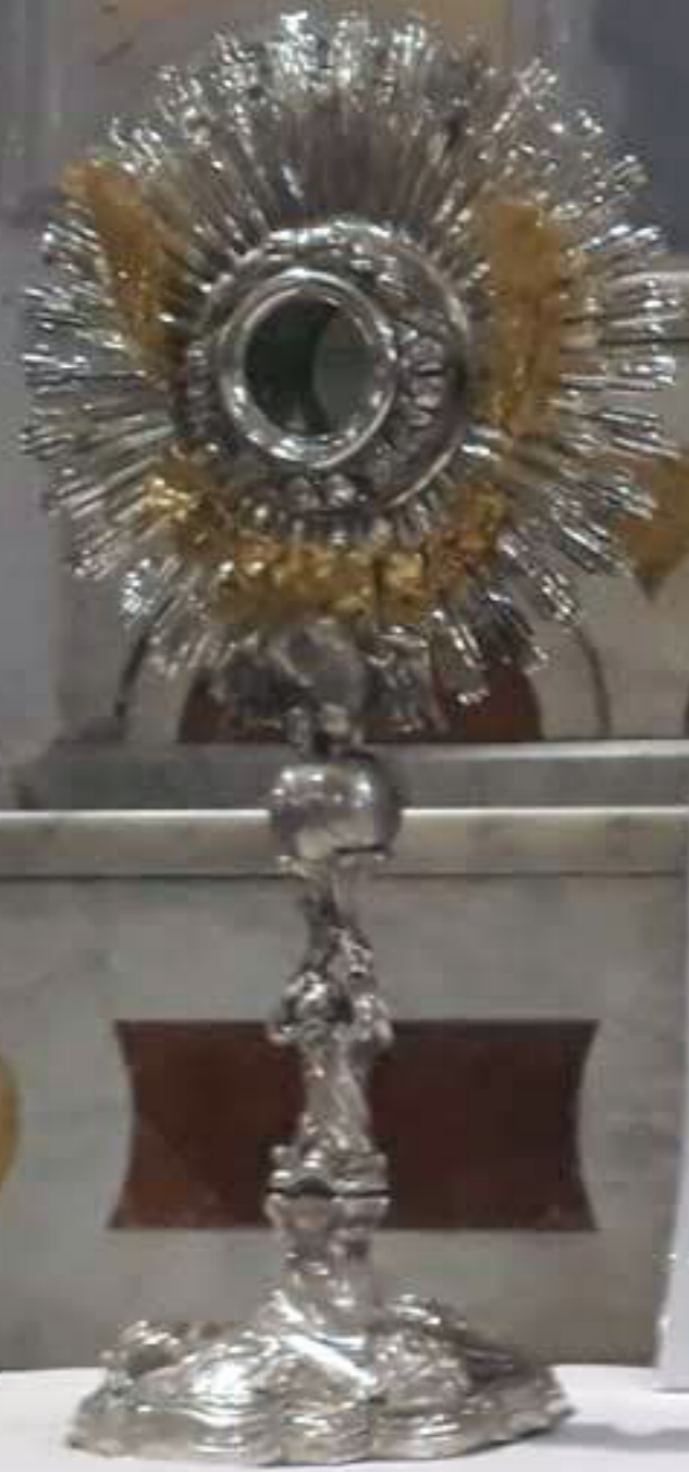
Argenteria di Palermo 1798 "Ostensorio a raggiera" argento, oro, smalto e lacca. Spesso ornato, sbalzato, cesellato, con parti avvolte. (Museum, Chiesa S. Sebastiano)