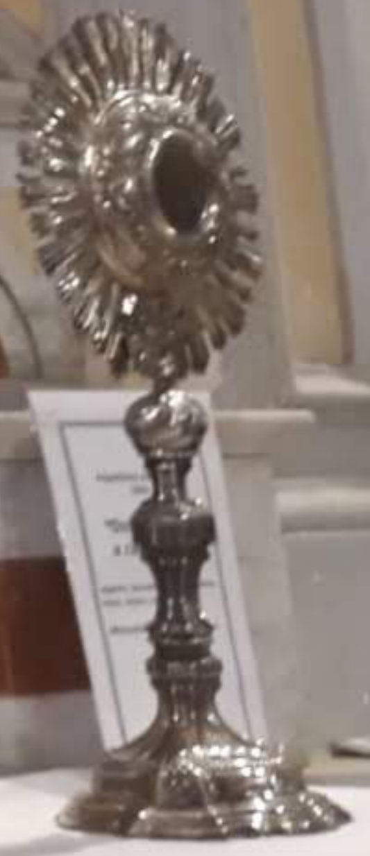
Argentiere palermitano "Ostensorio a raggiera" argento lavorato a mano, lamina- tione, sbalzo, eccollatura. (Mistretta, Chiesa Madonna del Carmine)