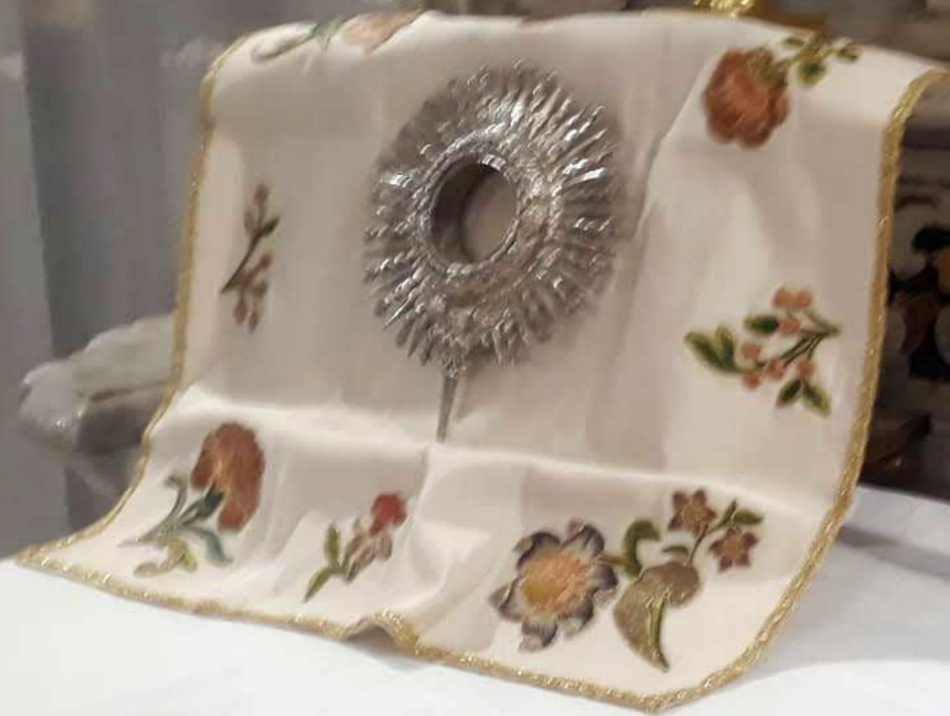
Argentiere di Messina Francesco Bruno seconda metà XVII sec. "Raggiata di ostensorio" caccante di tutto e piatte argento lavorato a fusione, laminazione, sbalzo, cesellatura (Mistretta, Chiesa Madre)