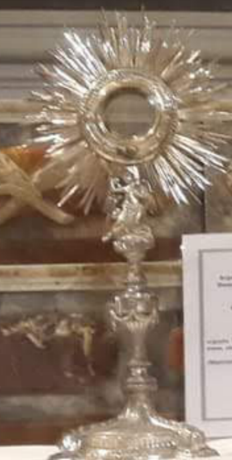
Regenerazione spirituale Benedicta 14.000, 1800 "Ostensorio a raggiata" argento, oro, smalto, pietre preziose, "Cristo, Santissimo" Benedicta, Chiesa Madre