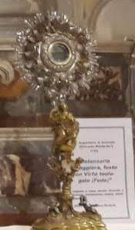
Regenerazione spirituale Benedicta 14.000, 1800 "Ostensorio a raggiata" argento, oro, smalto, pietre preziose, "Cristo, Santissimo" Benedicta, Chiesa Madre