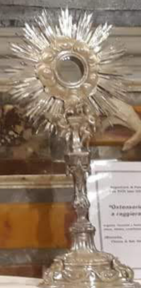
Regenerazione spirituale Benedicta 14.000, 1800 "Ostensorio a raggiata" argento, oro, smalto, pietre preziose, "Cristo, Santissimo" Benedicta, Chiesa Madre