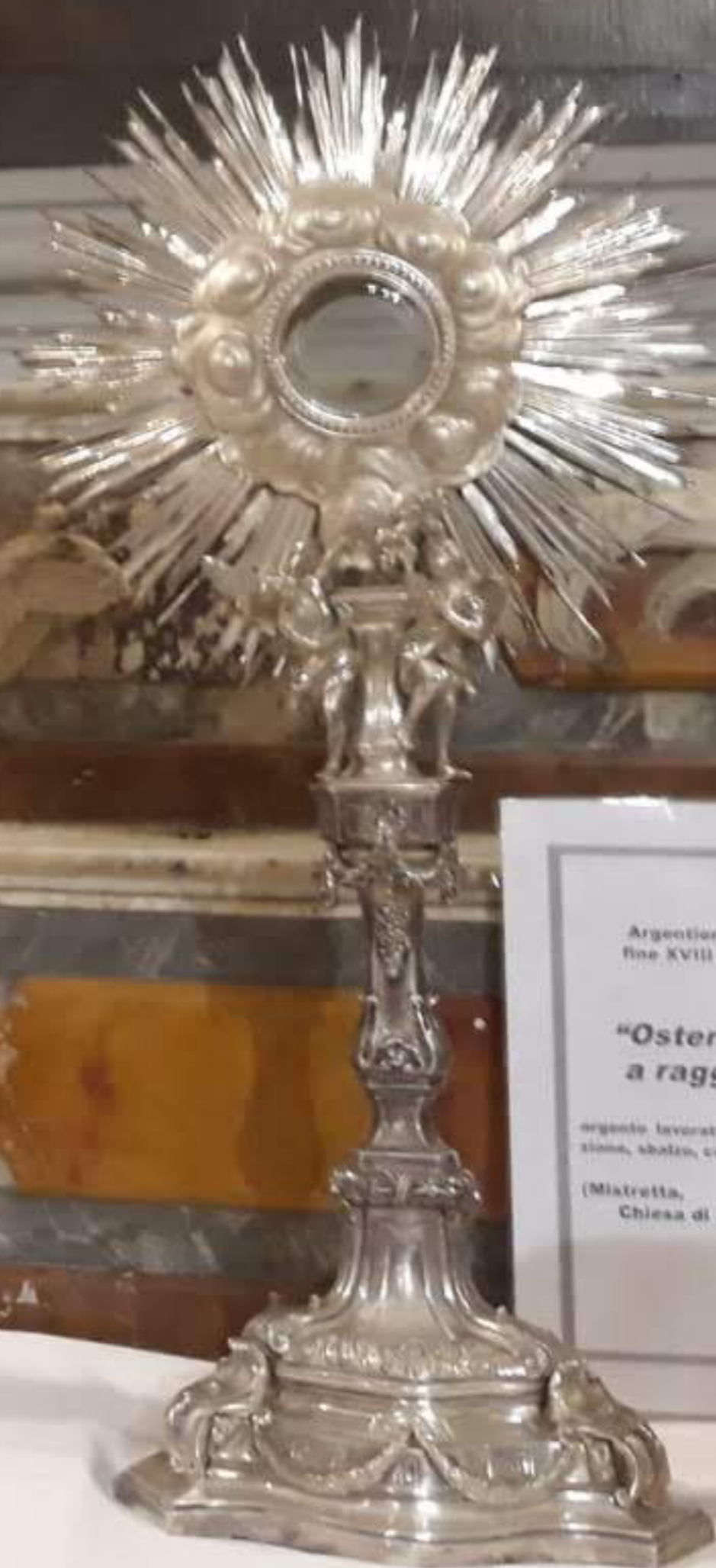
Argentiere di Palermo fine XVIII inol XIX sec. "Ostensorio a raggiera" argento lavorato a fusione, lamina- zione, sbalzo, cesellatura. (Mistretta, Chiesa di San Giovanni)