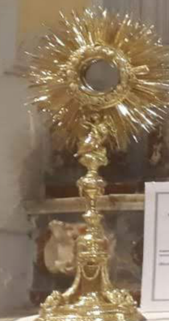
Regenerazione spirituale Benedicta 14.000, 1800 "Ostensorio a raggiata" argento, oro, smalto e pietre preziose, "Cristo, Santissimo" Benedicta, Chiesa Madre